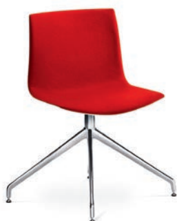
■ SEDUTA CATIFA 46

La prima, disegnata da Lievore Altherr Molina, riprende il modello Catifa 53 e fa della versatilità e della flessibilità due delle sue caratteristiche principali, soddisfacendo un'ampia gamma di applicazioni, dagli ambienti lavorativi a quelli domestici, senza mai perdere la propria originalità distintiva. A queste si aggiunge una forte personalizzazione. La scocca di Catifa 46 può infatti essere realizzata in legno multistrato curvato, polipropilene monocolore oppure bicolore