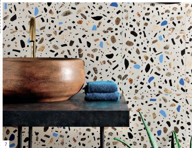
1. Special Bathroom, progetto di Marazzi 2. Riflessi di Cava, Antiche Fornaci D'Agostino 3. Res Art, Fondovalle 4. Pietragres, Ceramica Daytona 5. Carpet, Ceramica Francesco De Maio 6. System, Ceramica Vogue 7. FIO. Ghiaia, Ceramica Fioranese 8. Cromia, Ceramica Bardelli